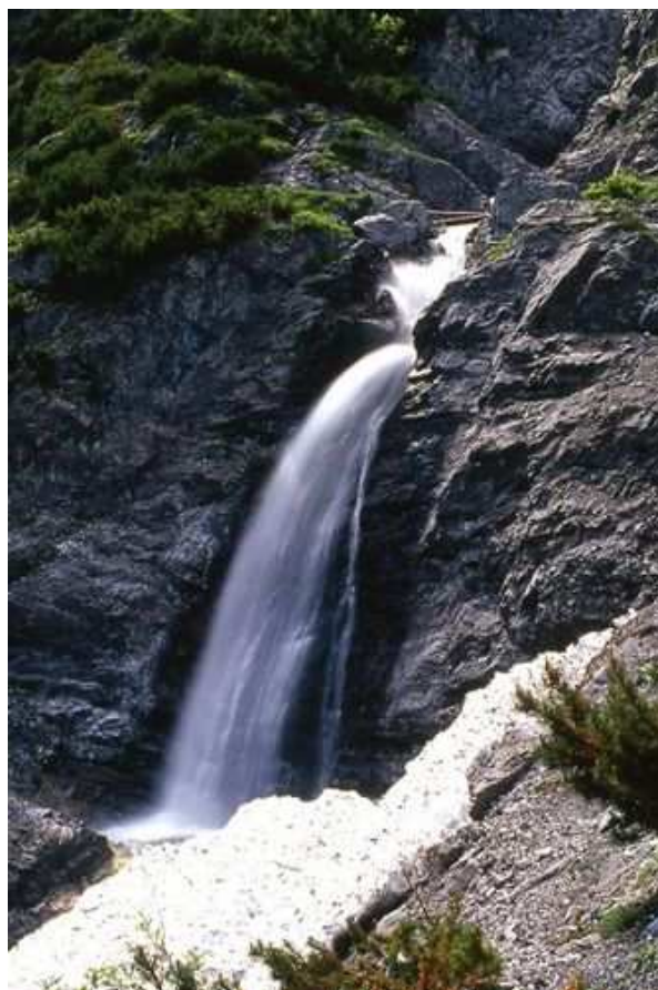
Vodopád u Drei Brunnen.