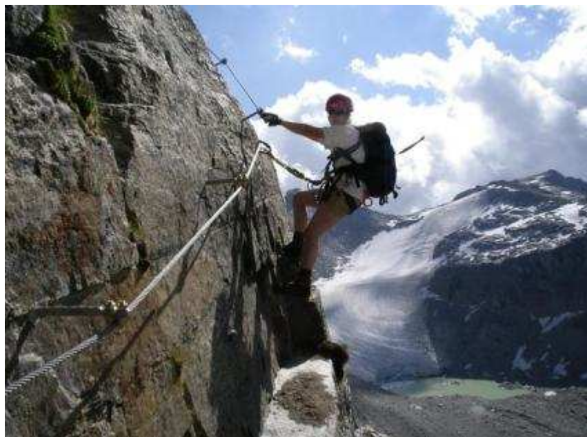
Na ferátě Tschenglsner Hochwand, vystavěné 2002.

Zkrácení trasy: na kříž. se zn. 12 za Düsseldorfer Hütte (Rifugio Serristori) doleva ke Kanzelhütte a sjet lanovkou č. 2 do údolí Innersulden a po cestě k penzionu.